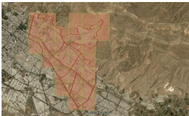
شکل ۲. شبکه‌بندی در روش RADIUS

نوع تحلیلی و توصیفی استفاده شده است. ابتدا با جست‌وجوی مقالات و کتاب‌ها و منابع موجود، کار کتابخانه‌ای و توصیفی شروع گردید. در ادامه، با بازدید از منطقه ۳ شهرداری شیراز و بررسی زمین‌شناسی و موقعیت زمین‌ساختی منطقه تحت مطالعه، روش پیمایشی و تحلیلی انجام گرفت. برداشت‌های میدانی شامل جمع‌آوری اطلاعات مربوط به پارامترهای ساختمانی چون وضع موجود کاربری‌ها، چگونگی توزیع آنها و نوع سازه بنا بود. سپس خطر زلزله ارزیابی شد. اولین گام در هر گونه ارزیابی خطر زلزله، شناسایی ویژگی‌های منابع زلزله است. تعیین پارامترهای زلزله محتمل مانند مکان گسل، هندسه آن جهت‌گیری و حداکثر بزرگی زلزله ضروری است (وانگ و همکاران، ۲۰۰۰: ۲). لذا برای برآورد شدت لرزه‌ای (شدت حرکت زمین) و خسارت وارده به ساختمان‌ها، داده‌های تراکم جمعیتی، نوع ساختمان‌ها و توزیع آنها، اندازه و حد و مرز منطقه تحت مطالعه و نوع خاک در روش RADIUS به عنوان اطلاعات پایه وارد می‌شود. در کل، فرایند تخمین خسارات ناشی از زلزله در نرم‌افزار RADIUS را در مراحل زیر می‌توان اجرا کرد: - شبکه‌بندی منطقه: برای انجام تخمین خسارت، منطقه تحت بررسی باید شبکه‌بندی شود. برای اجرای شبکه‌بندی از شبکه‌های بین ۵۰۰ مترمربع تا ۲ کیلومترمربع استفاده می‌کنند. هر چه اندازه شبکه‌ها کوچک‌تر باشد، میزان اطلاعات بیشتری نیز به تعداد شبکه‌ها باید وارد سیستم شود. در این مطالعه اندازه شبکه‌ها ۱ کیلومترمربع در نظر گرفته شده است (شکل ۲).