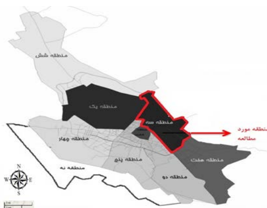
شکل ۳. موقعیت منطقه ۳ شهرداری در شهر شیراز

نفر در هکتار است و در سیستم شهری شیراز یکی از زیرسیستم‌های مؤثر تلقی می‌شود. در شکل ۳ موقعیت منطقه ۳ در شهرداری شیراز نشان داده شده است.