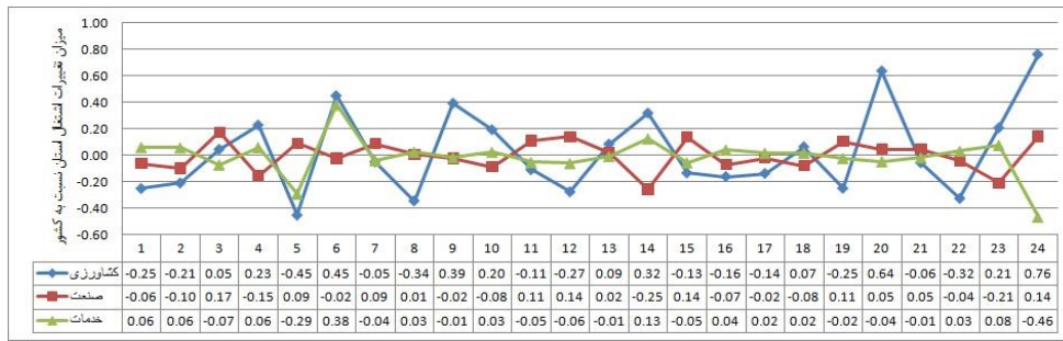
شکل ۳. نمودار تغییرات دوره‌ای شاخص اشتغال جمعیت شهری استان کهگیلویه و بویراحمد در بخش‌های اقتصادی ( C_s و C_i , C_a )