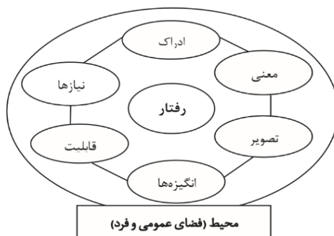
شکل ۱. عوامل تشکیل‌دهنده فرد در محیط