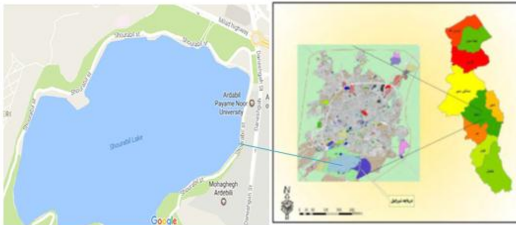
نقشه ۱. محدوده مورد مطالعه