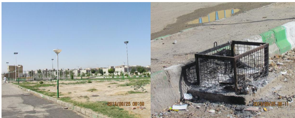
شکل ۱. نمایشی از وضعیت مبلمان شهری در سطح شهر زاهدان