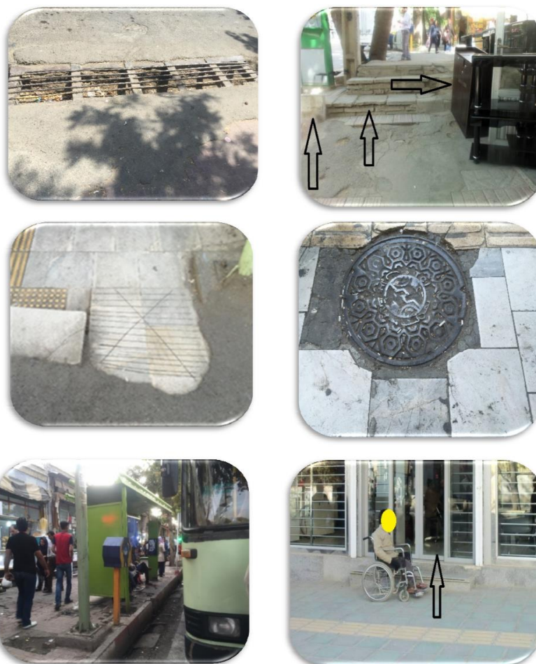
شکل ۳. نمایی از فضاهای عمومی نامناسب در محدوده مورد مطالعه