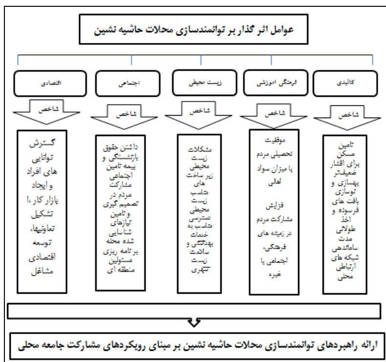
شکل ۱. مدل مفهومی پژوهش

با توجه به پیشینه پژوهش و شناسایی عوامل و متغیرهای تسهیل‌کننده، فرایند توانمندسازی محله‌های حاشیه‌نشین در قالب سه رویکرد ارزش‌مبنا، دارایی‌مبنا و نیازمبنا به‌عنوان سه دیدگاه مکمل در پژوهش حاضر شناسایی و تعریف عملیاتی شد. در شکل ۱ مدل مفهومی آمده است.