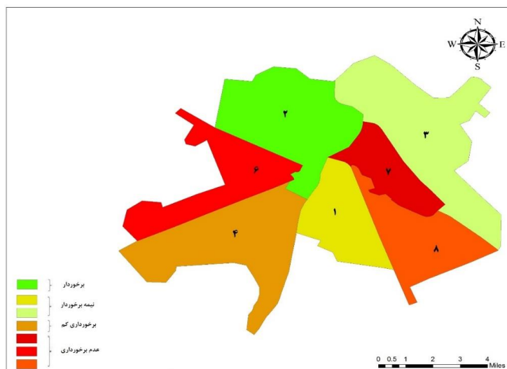
شکل ۳. برخورداری مناطق شهر اهواز از شاخص های پایداری براساس مدل ویکور