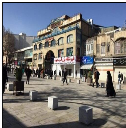
شکل ۴. سنجش مؤلفه هویتی-معنایی