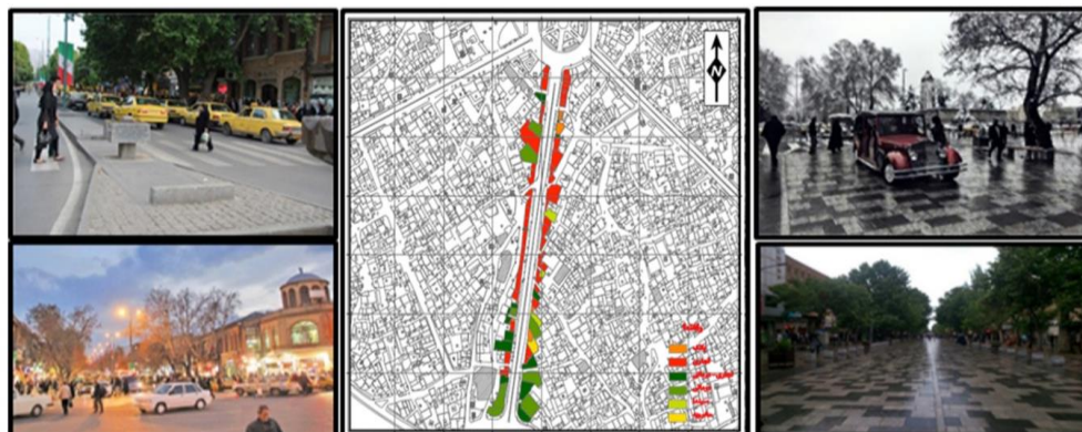
شکل ۱. نقشه کاربری و نماهایی از پیاده‌راه بوعلی

کاربری غالب در محور بوعلی شامل کاربری‌های تجاری است، اما کاربری‌های فرهنگی و درمانی نیز در آن به‌چشم می‌خورد و به همین دلیل شهروندان حضور چشمگیری در طول ساعات روز در این خیابان دارند. پس از تبدیل خیابان بوعلی به پیاده‌راه شهری، شاهد رونق در برگزاری آیین‌های جمعی، جشنواره‌ها، اعیاد مذهبی و رویدادها و وقایع مختلف فرهنگی و اجتماعی در فضا هستیم. قرارگیری محور در محدوده مرکزی و در ارتباط با استخوان‌بندی اصلی شهر، نفوذپذیری کالبدی و بصری مطلوبی را برای آن فراهم کرده است. عمده آلودگی‌های بصری در این خیابان به‌دلیل پراکندگی تابلوهای مطب پزشکان و نامنظمی خط آسمان در این محدوده است.