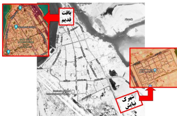
شکل ۱. موقعیت بافت قدیم و شهرک نیایش در شهر بوشهر